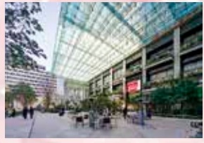
日本橋室町三井タワー大ひさしガラス

私は現在、工事営業部に所属し、主に「断熱窓のリフォーム」のご紹介や販売に携わっています。日本の住宅において、冬の寒さや夏の暑さの最大の原因は「窓」にあります。お住まいの窓に内窓を取り付けたり、ガラスを交換したりするだけで、住まいの断熱性能は劇的に向上します。私の役割は「光熱費を抑えたい」「結露に悩んでいる」というお客さま一人ひとりの課題に寄り添い、最適な開口部リフォームプランをご提案することです。日々の業務の中で、イベントや対面での説明をとおして、身近にありながら意外と知られていない窓の重要性や、断熱リフォームがもたらす「健康で快適な暮らし」の価値をお伝えしています。施工後にお客さまから「内窓をつけて心地いい部屋になった」と笑顔で喜んでいただけると最も嬉しく、自分の仕事にやりがいを感じる瞬間です。